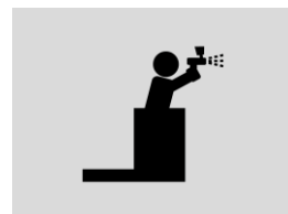
Standaard volledig geschoopeerd